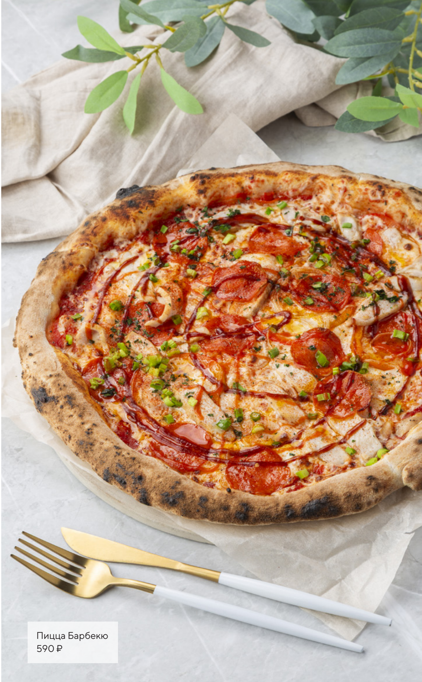
Пицца Барбекю 590 ₺