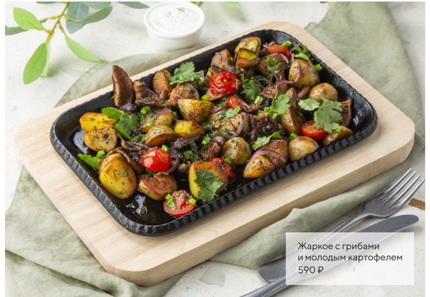
Жаркое с грибами и молодым картофелем 590 ₺