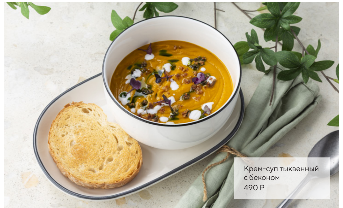
Крем-суп тыквенный с беконом 490 ₺