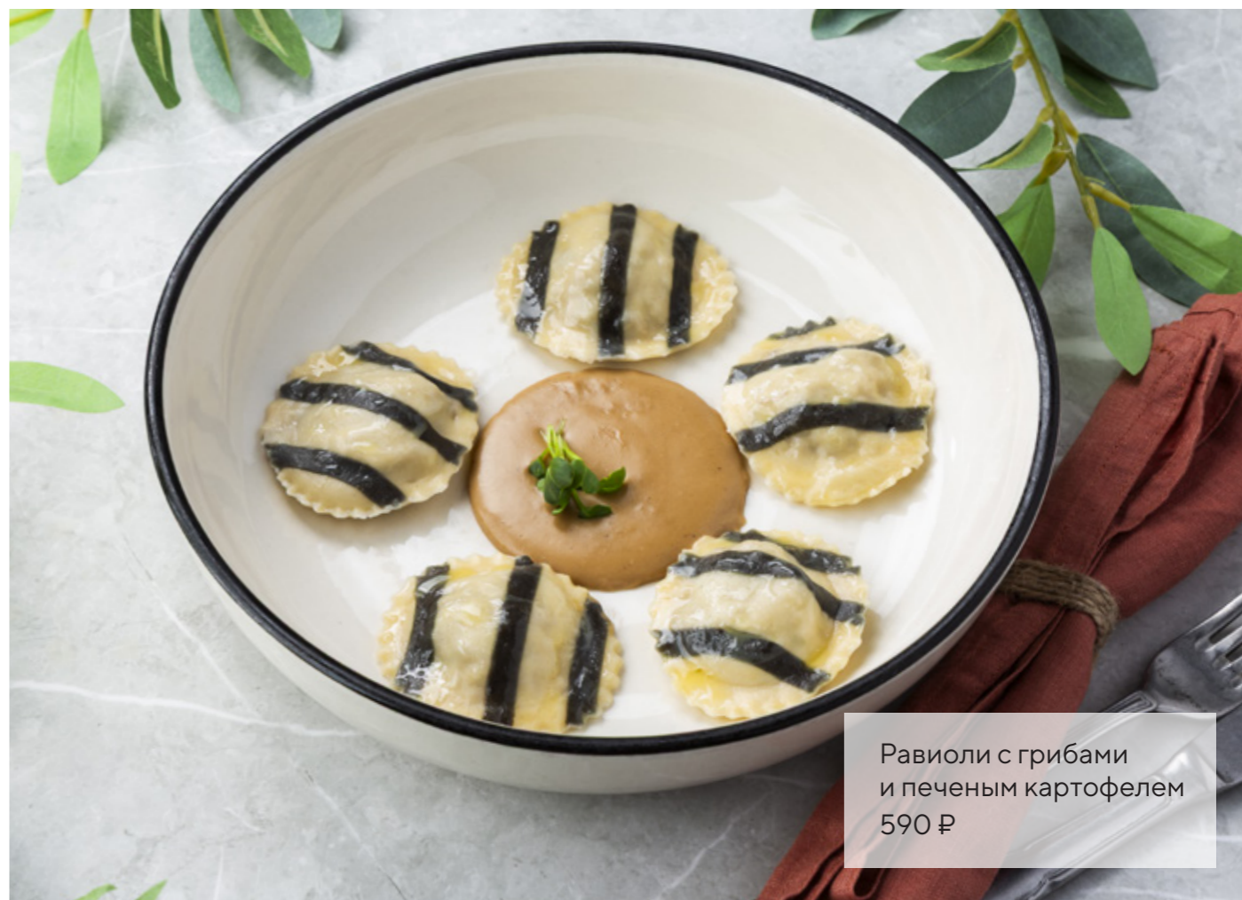
Равиоли с грибами и печеным картофелем 590 ₽