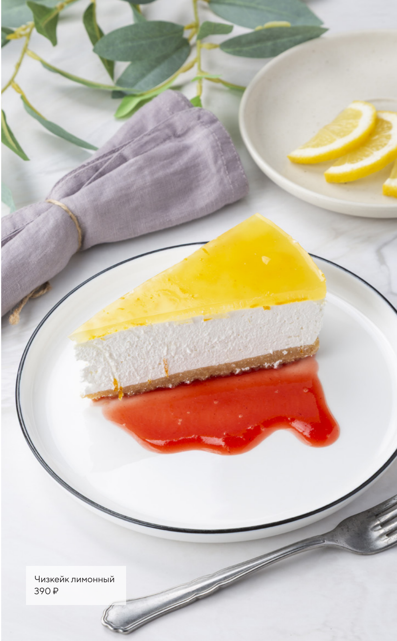
Чизкейк лимонный 390 ₺