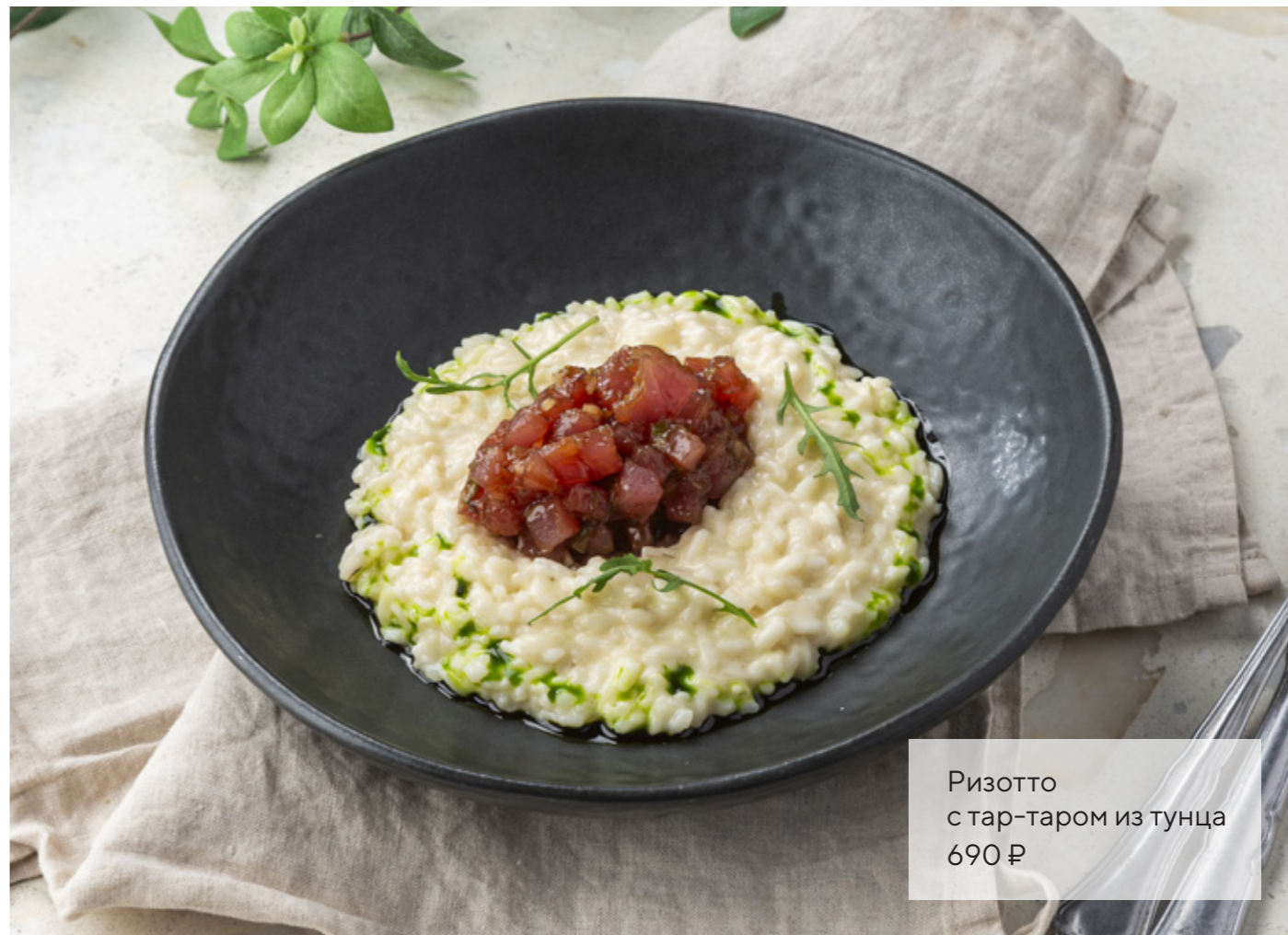
Ризотто с тар-таром из тунца 690 ₽