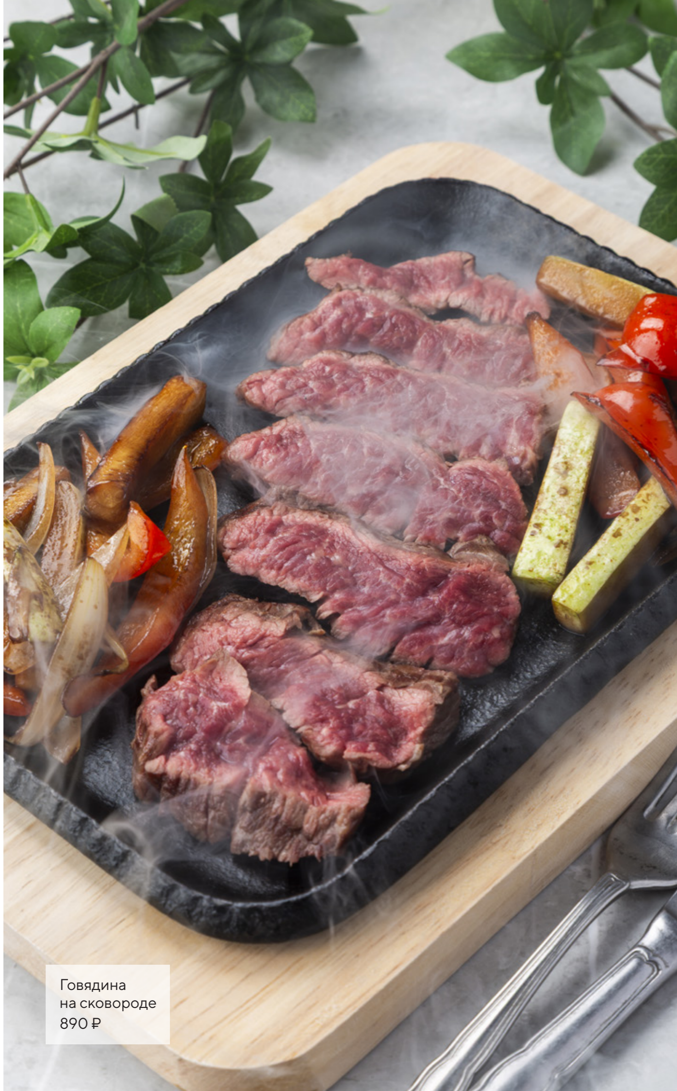
Говядина на сковороде 890 ₺