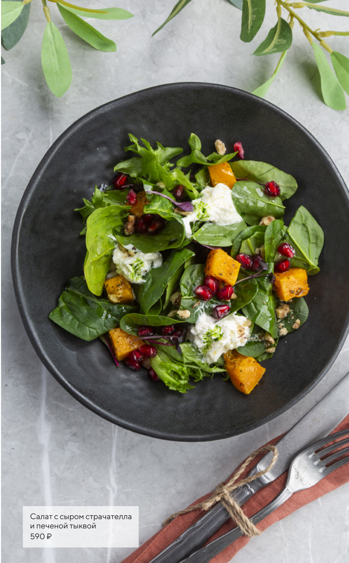
Салат с сыром страчателла и печеной тыквой 590 ₺