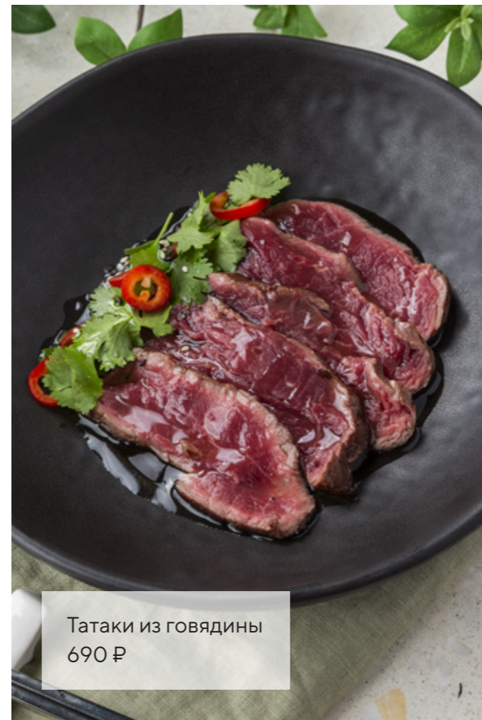
Татаки из говядины 690 ₺