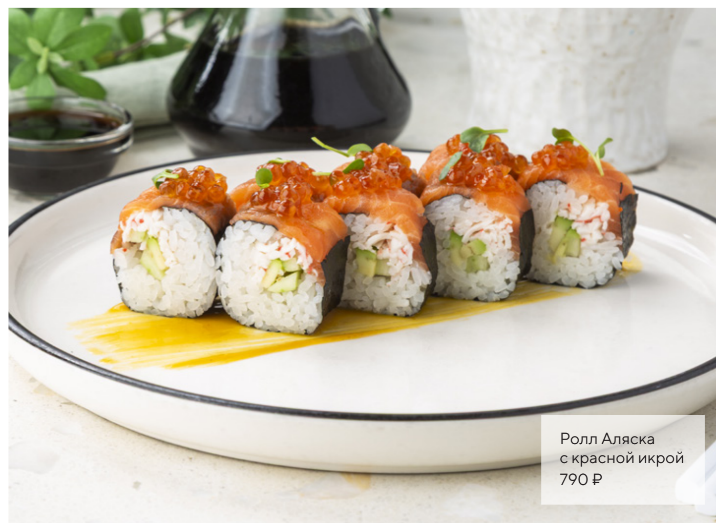
Ролл Аляска с красной икрой 790 ₺