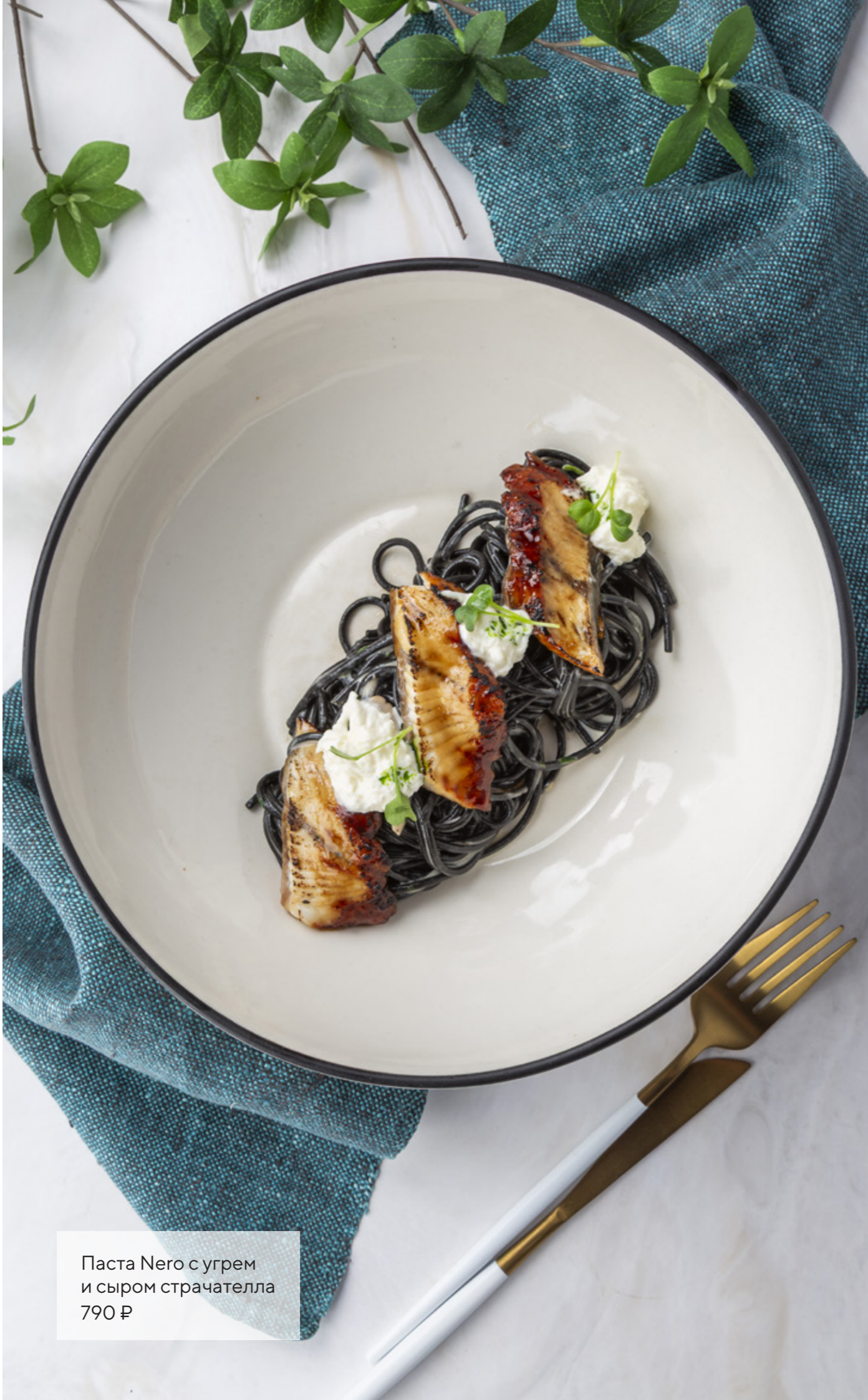
Паста Nero с угрем и сыром страчателла 790 ₽