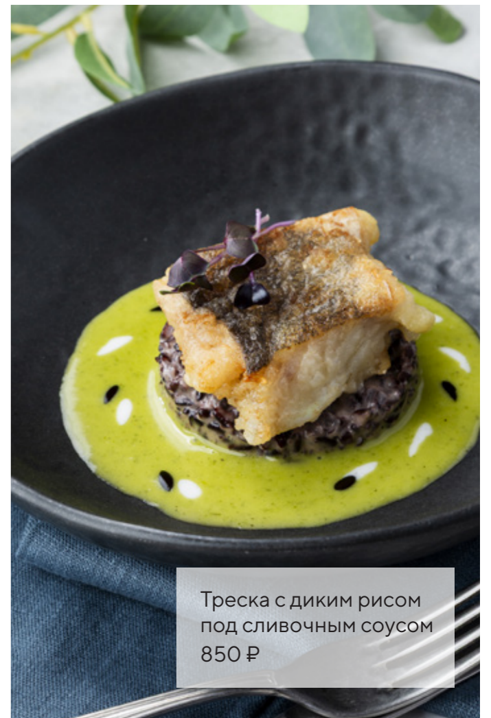
Треска с диким рисом под сливочным соусом 850 ₺