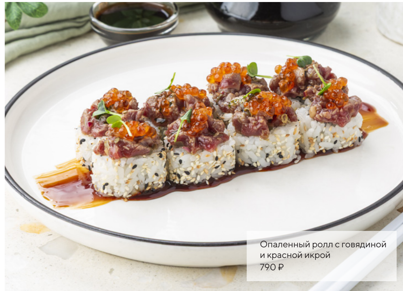
Опаленный ролл с говядиной и красной икрой 790 ₺